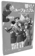
■響け! ユーフォニアム 北宇治高校吹奏楽部へようこそ! 武田綾乃 / 著 宝島社 2009年

小中学校の6年間を豊島区立の学校で過ごす。中学校在学中に吹奏楽部に入学したのがきっかけで、中学・高校を卒業してからも吹奏楽を続けている。現在は大学で芸術学を専攻。