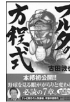
■フルタの方程式 古田敦也 / 著 朝日新聞出版 2009年

立教大学体育会応援団 リーダー部 二年 元高校球児。大学でも大好きな野球に携わりたという思いから、一念発起して応援団に加入。現在も奮闘中の日々を送る。