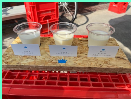
クラフトミルク飲み比べ

濃厚で後味にコクがあり、同じ東京都にある牧場の牛乳だと思えば、味わい深いです。直営カフェで食べるソフトクリームもさっぱりとして美味しいです。